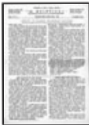
Il 1° numero